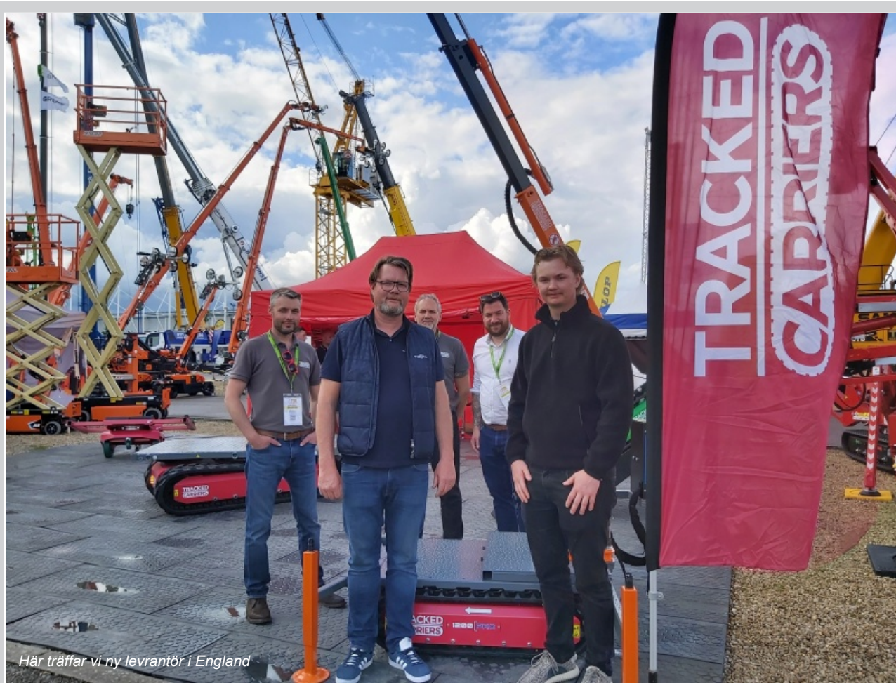
Här träffar vi ny leverantör i England